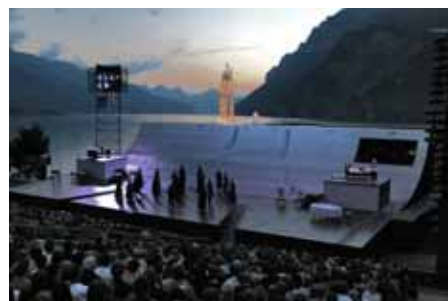
Bühne vom Heidi Musical